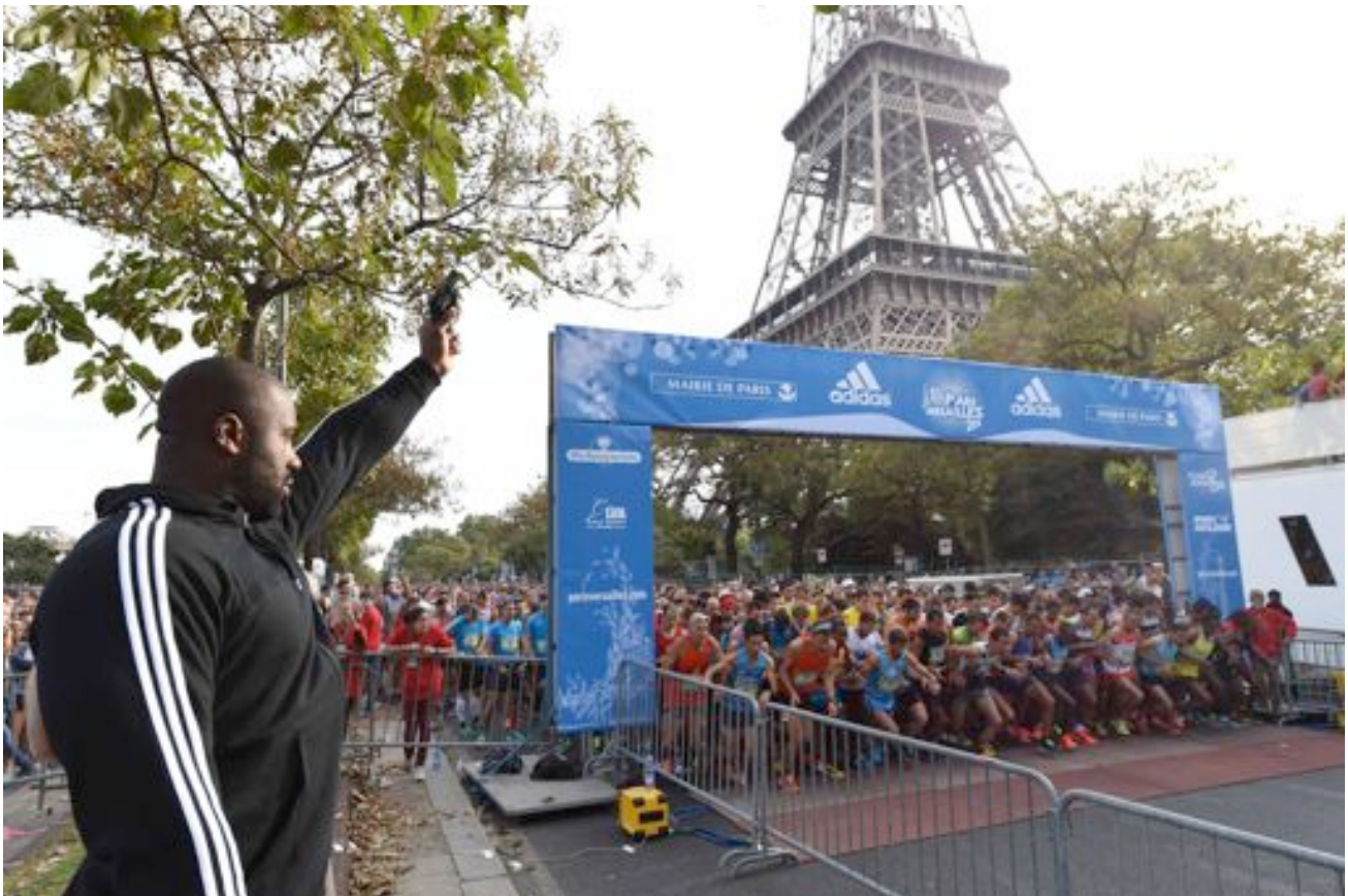
25 000 coureurs se sont élancés ce matin au départ de la Tour Eiffel et au coup de starter donné par le champion olympique de judo, Teddy RINER.